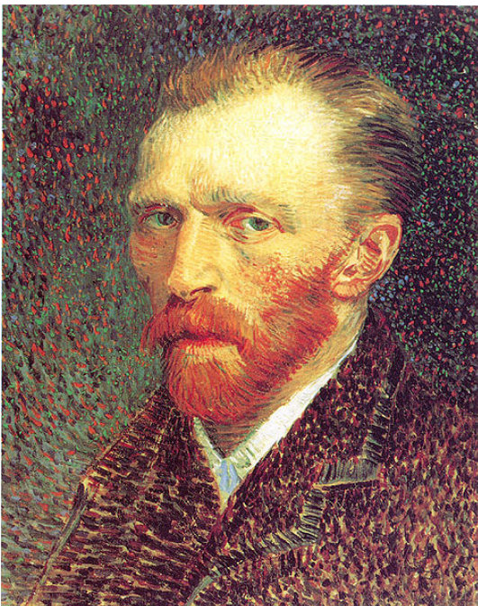
Van Gog- Autoportret

Rođen je 30.3.1853. u selu Groot-Zunderd u južnom delu Holandije. Otac mu je bio Poglavar Reformisane Holandske crkve. Vinsent je ime dobio po svom dedi, takođe i po, na nesreću, bratu koji je mrtvoroden godinu dana pre njega, što nije bila neuobičajena praksa davanja imena u to doba, naručito uzevši u obzir da je u van Gog familiji bilo dosta ljudi sa ovim imenom. Njegov deda je takođe bio teolog i imao je šest sinova od kojih su tri kasnije postali trgovci umetničkim delima, a jedan od njih je i čuveni stric Sent koji se kasnije pominje u